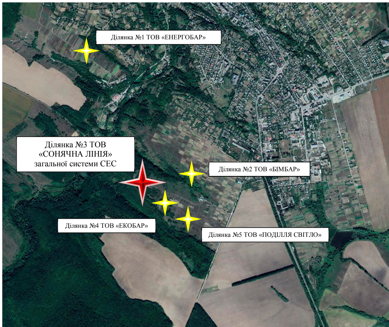
Рис. 1 – Місце розташування об'єкту планової діяльності

Згідно довідки, наданої Управлінням культури і мистецтв Вінницької обласної державної адміністрації, об'єкти культурної спадщини на даній земельній ділянці відсутні.